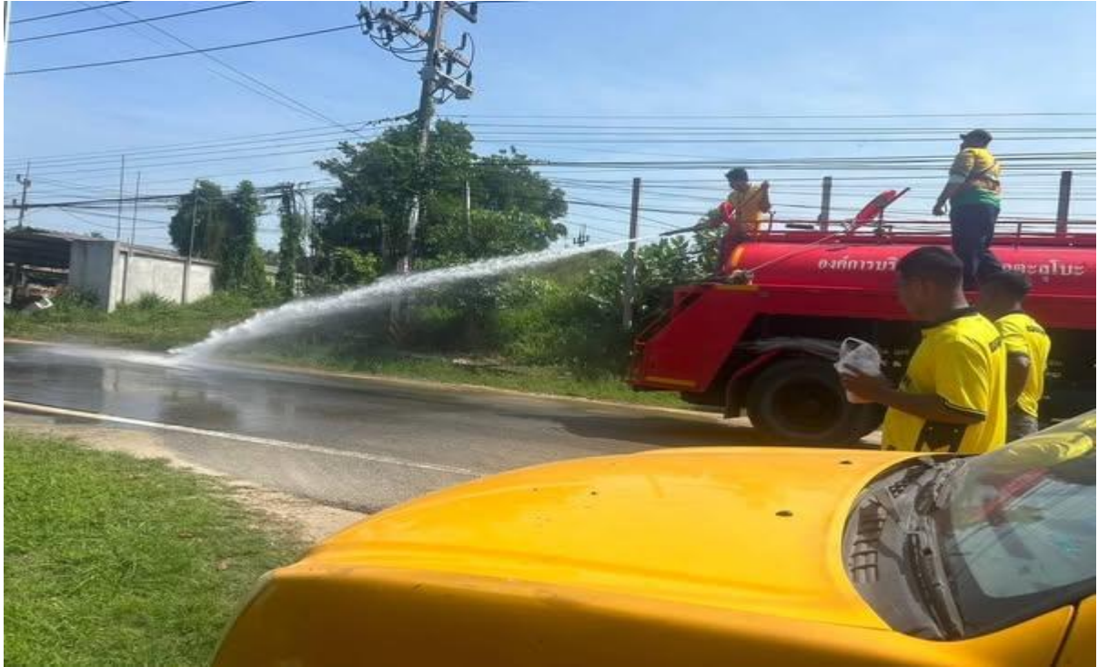
ไฟฟ้าสาธารณะ เพื่อสร้างความปลอดภัยให้กับประชาชน